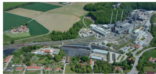
Ortsteil Werk Hart Unterneukirchen