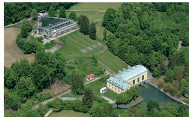
Wasserkraftwerk in Ortsteil Mühltal

SunnySideResidence GmbH & Betreutes Wohnen „Alte Schmiede“ Tel. 08634 / 625750 eMail: sunnysidecare.de